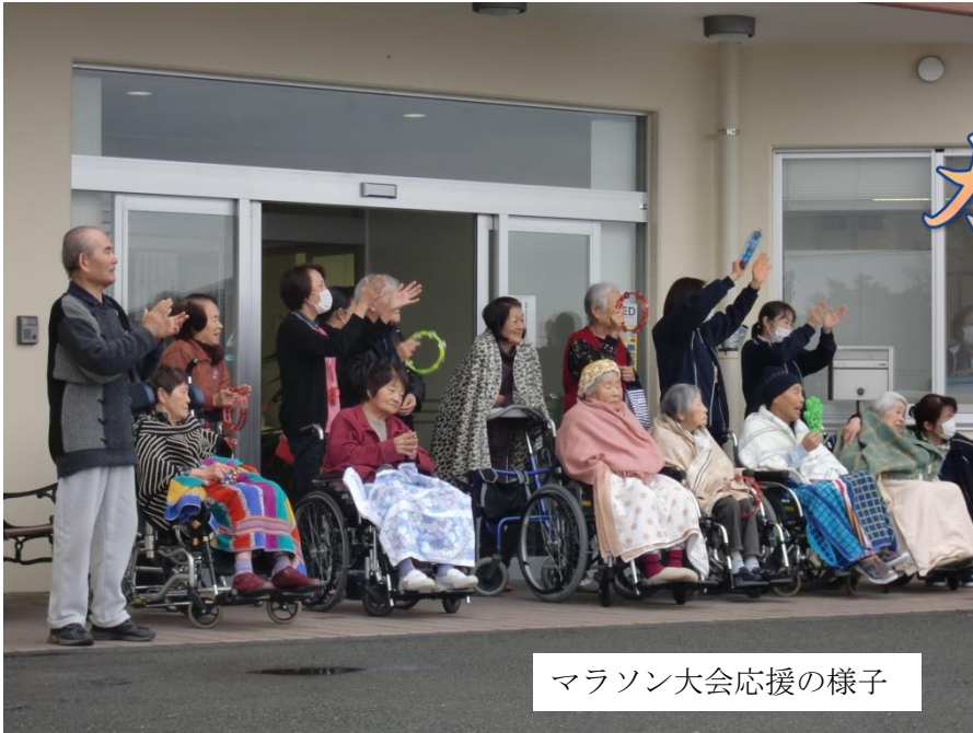
マラソン大会応援の様子