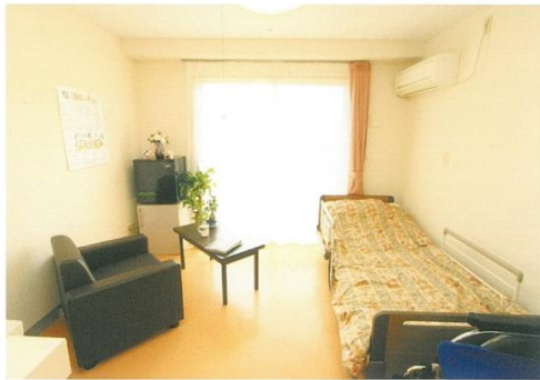
▲静かで落ち着いた居室