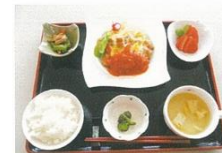
▲栄養バランスのとれた食事