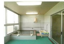
▲温かいお風呂でリラックスタイム